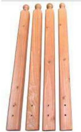
A - Słupek – 4 szt.