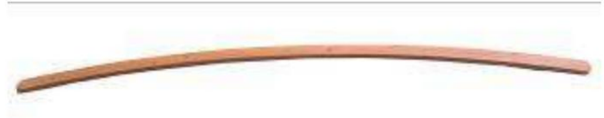
C - Balustrada słupkowa – 4 szt.