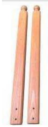
B - Słupek – 2 szt.